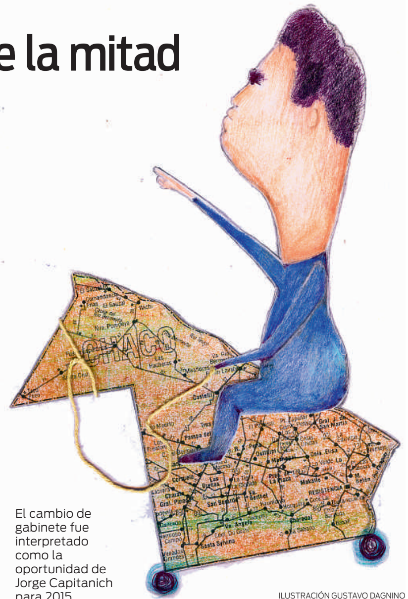
El cambio de gabinete fue interpretado como la oportunidad de Jorge Capitanich para 2015.

Contraviniendo toda épica, por los tirantes y urgido por la Justicia argentina; Guillermo Moreno se está fugando a Italia.