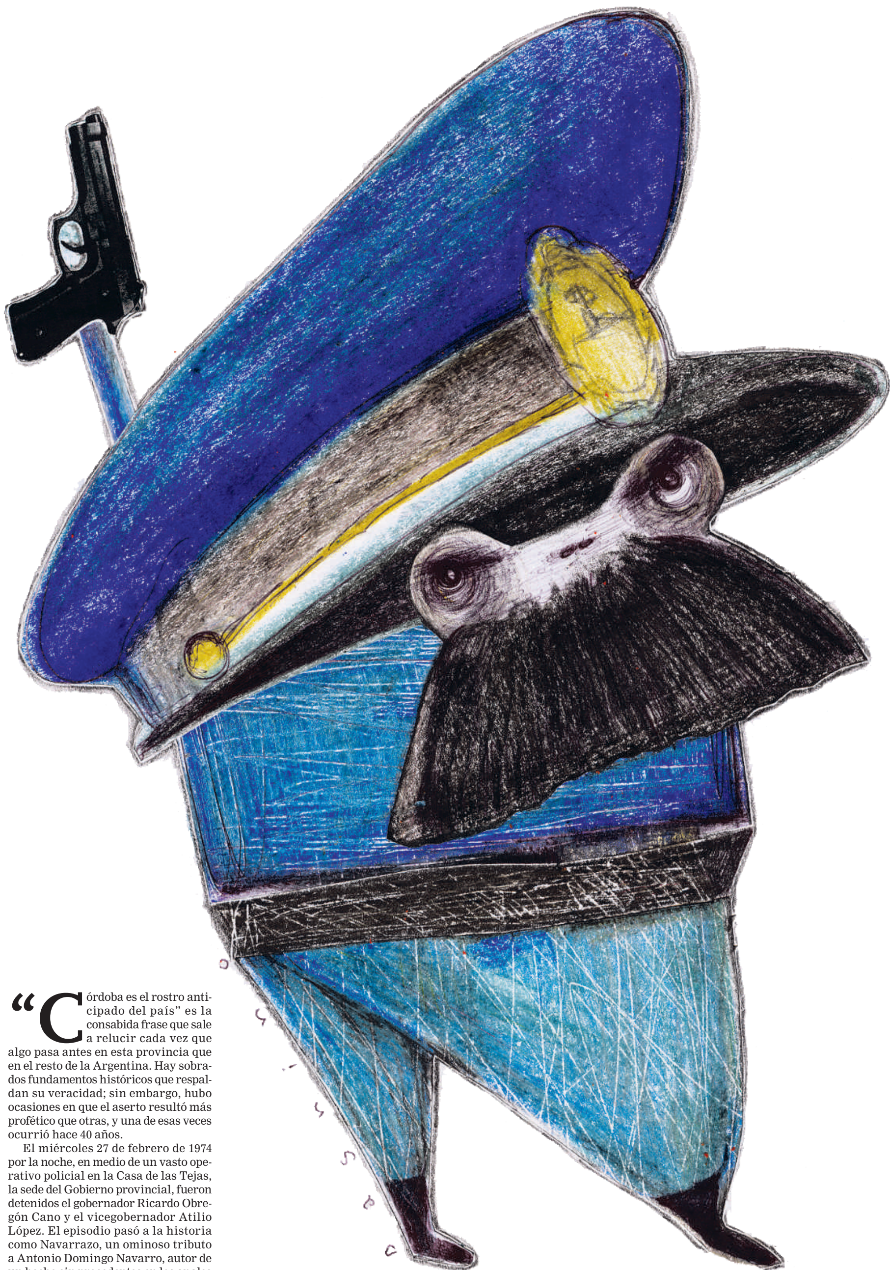
ILUSTRACIÓN GUSTAVO DAGNINO

“Córdoba es el rostro anticipado del país” es la consabida frase que sale a relucir cada vez que algo pasa antes en esta provincia que en el resto de la Argentina. Hay sobrados fundamentos históricos que respaldan su veracidad; sin embargo, hubo ocasiones en que el aserto resultó más profético que otras, y una de esas veces ocurrió hace 40 años.