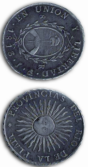
LAS PRIMERAS MONEDAS PATRIAS DESDE ABRIL DE 1813. FUERON ACUNADAS EN POTOSÍ (BOLIVIA).

A pesar que la Asamblea del año XIII no declaró la independencia de España, manifestó la vocación independentista de los patriotas.