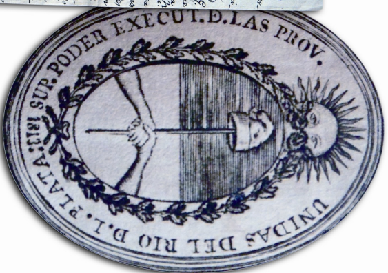
EL ESCUDO TAMBIÉN LLAMADO EN AQUEL MOMENTO SELLO OFICIAL, FUE CREADO EL 13 DE MARZO DE 1813. ACTA DE JURAMENTO EL 2 DE FEBRERO DE 1813 SE RESOLVIÓ EN LA ASAMBLEA LA JIRA DE UN NUEVO GOBIERNO.