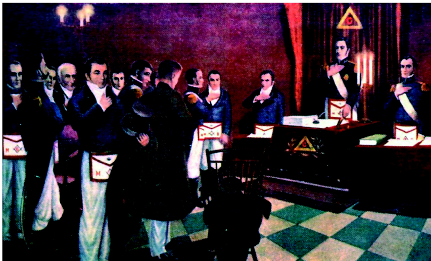
LOGIA DE BUENOS AIRES LOS PATRIOTAS INTERSADOS EN INGRESAR A ESTA SOCIEDAD SECRETA, ERAN ELEGIDOS Y JURABAN FIDELIDAD AL INCORPORARSE.