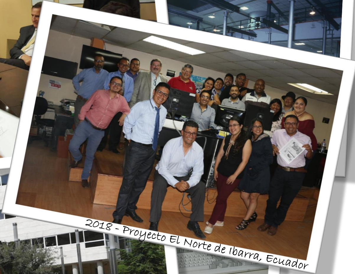
2018 - Proyecto El Norte de Ibarra, Ecuador