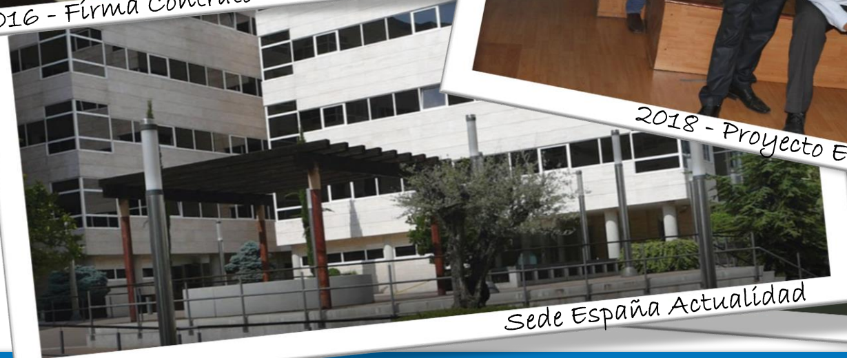
Sede España Actualidad