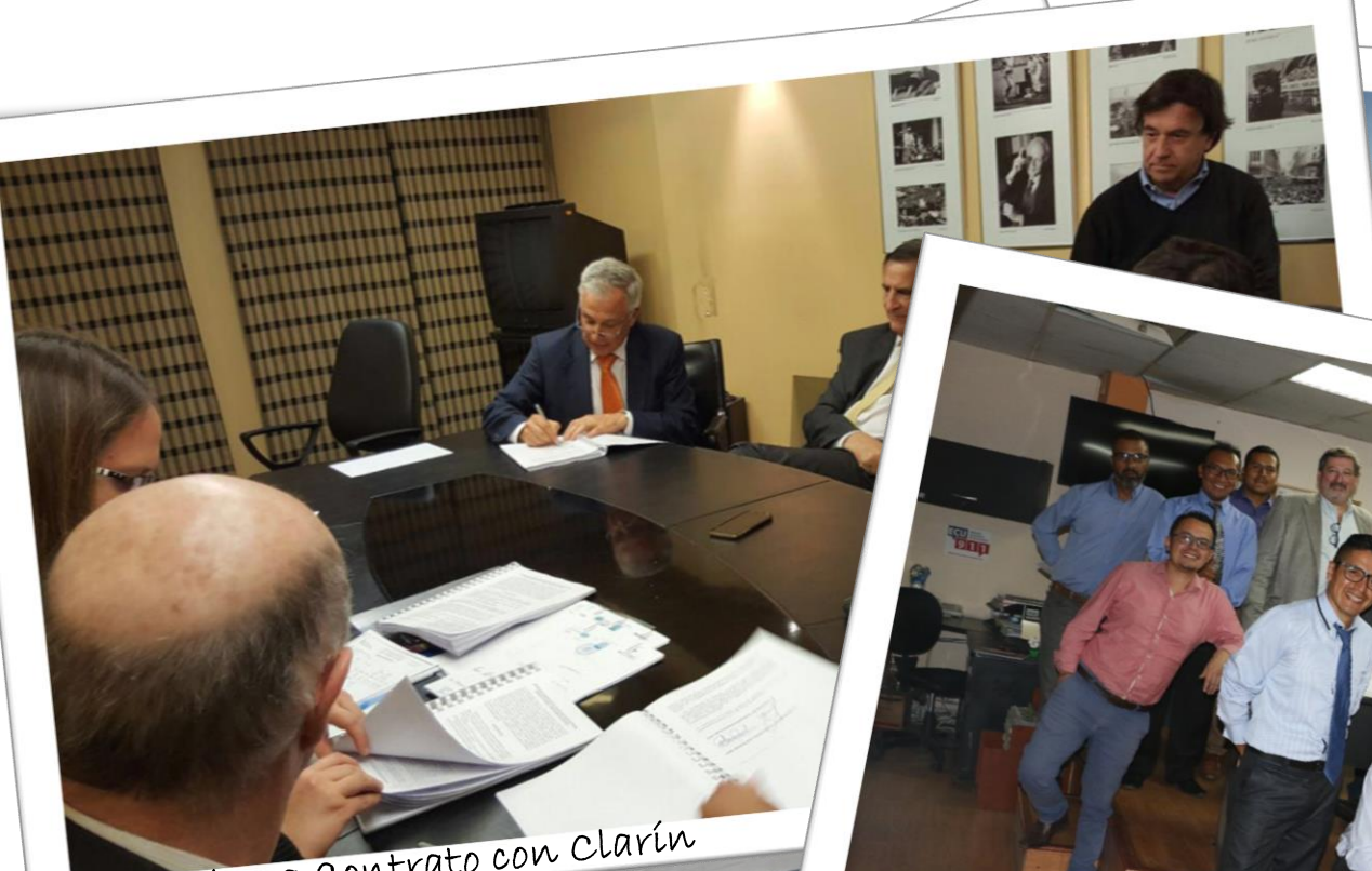
2016 - Firma Contrato con Clarín