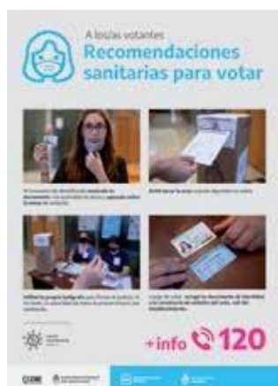
Recomendaciones sanitarias para votar