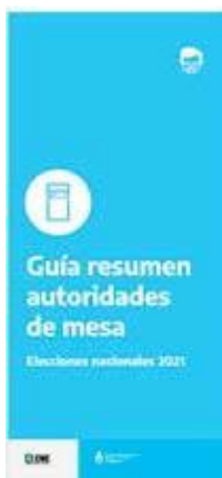
Guía resumen para autoridades de mesa