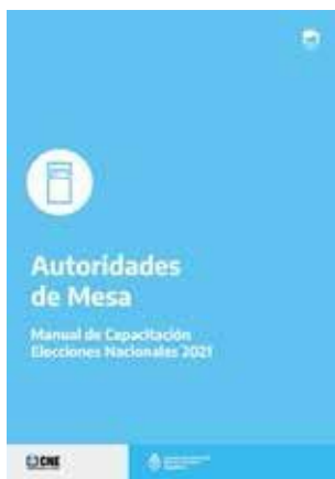
Manual de capacitación para autoridades de Mesa