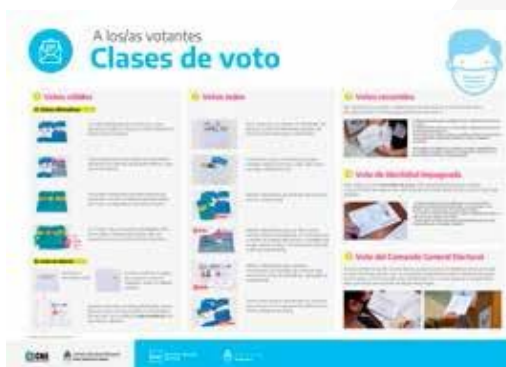
Clases de Votos