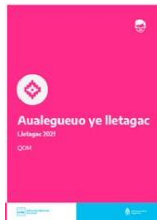
Participar es tu derecho | Qom