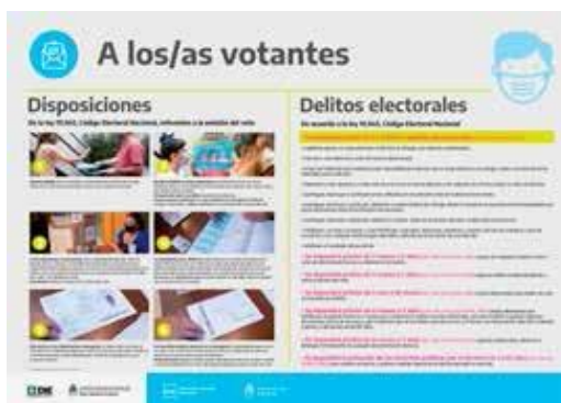
Disposiciones y Delitos Electorales