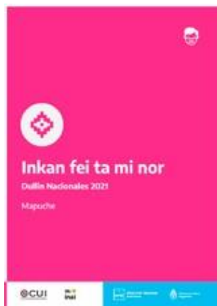
Participar es tu derecho | Mapuche