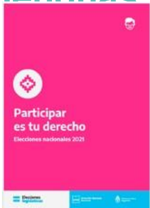
Participar es tu derecho