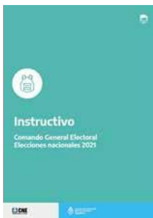
Instructivo Comando General Electoral