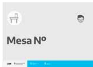
Cartel Número de mesa