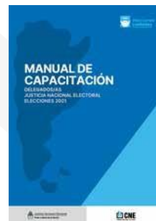
Manual de capacitación para delegados y delegadas de la Justicia Nacional Electoral