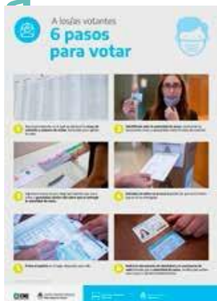
Pasos para votar