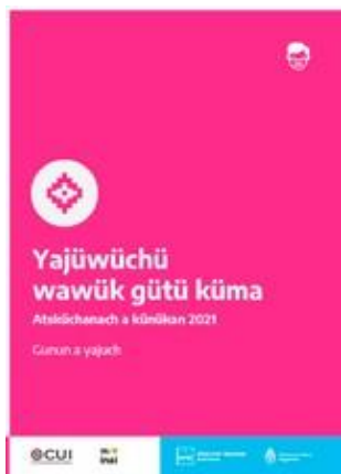
Participar es tu derecho | Gunun a Yajuch