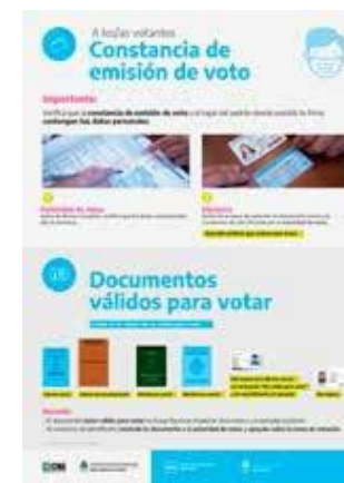
Constancia de Emisión de Voto y documentos válidos para votar