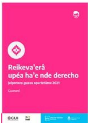
Participar es tu derecho | Guaraní