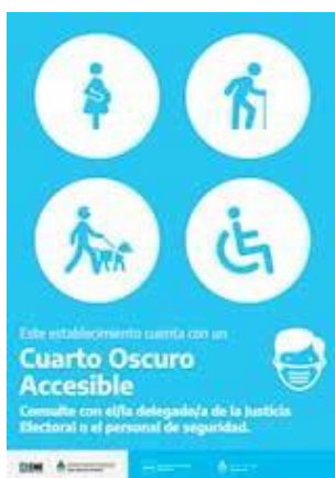
Cuarto Oscuro Accesible (COA)