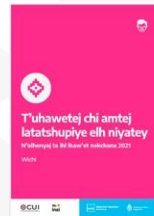
Participar es tu derecho | Wichi