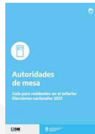
Guía para autoridades de mesa | Residentes en el exterior