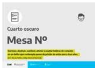
Cartel Cuarto oscuro