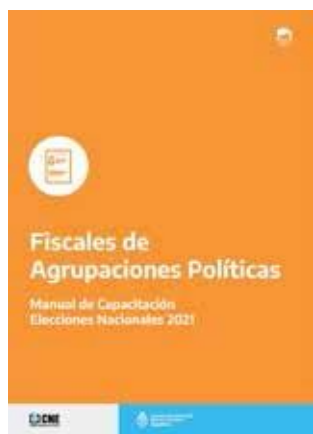
Manual de capacitación para fiscales de agrupaciones políticas