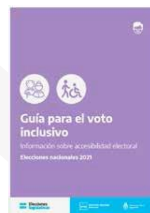
Guía de voto inclusivo