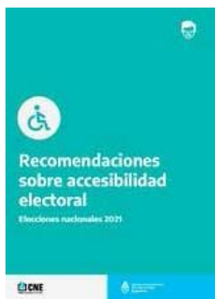
Recomendaciones sobre accesibilidad electoral