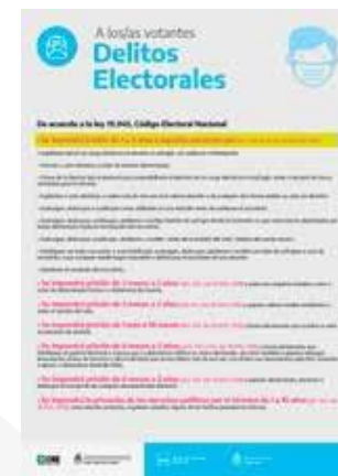
Disposiciones y Delitos Electorales | Privados de la Libertad