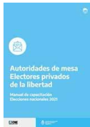
Manual para electores privados de la libertad | Autoridades de Mesa