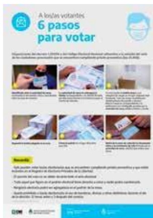
Pasos para votar | Privados de la Libertad