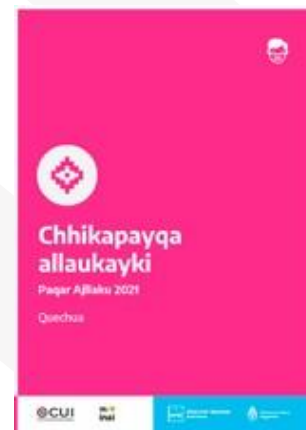
Participar es tu derecho | Quechua