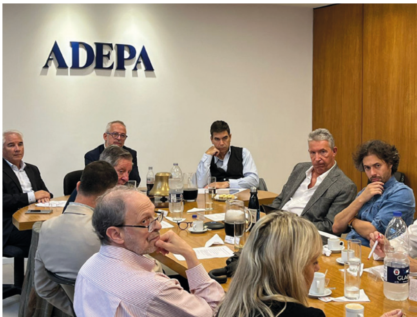
Reunión del Consejo Ejecutivo de ADEPA.