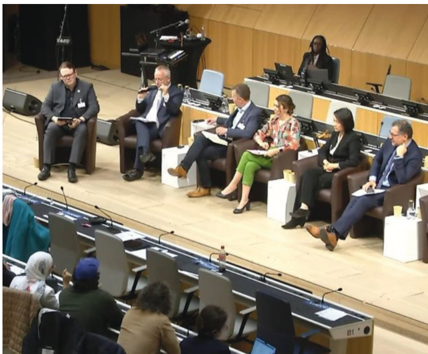
El panel sobre IA se llevó a cabo en la sede de OMPI en Ginebra.

A su vez explicó cómo la Inteligencia Artificial Generativa tendría que implementarse en la industria periodística a través de buenas prácticas en el uso de estas tecnologías: “En el campo del periodismo creemos que la IAG debe desarrollarse de acuerdo a las leyes y principios que protejan la propiedad intelectual, pero que también protejan el valor de las marcas de los editores periodísticos, las relaciones confiables que tenemos con nuestras audiencias. Escuchaba a la colega