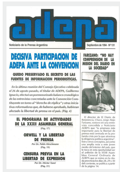
Septiembre de 1994.