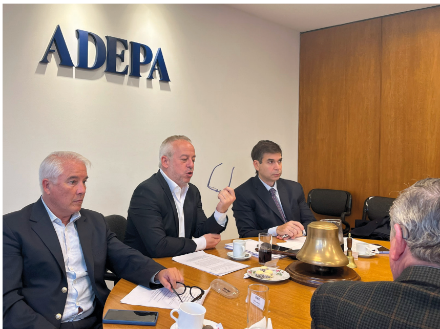
Reunión del Consejo Ejecutivo de ADEPA.