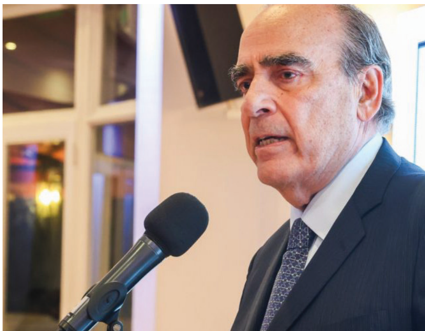
Guillermo Francos, Jefe de Gabinete de la Nación.

cracia en la Argentina, que se conmemoraron el año pasado: “El único resultado que pudimos ofrecer es la democracia, que no es menor ya que hay países que no la tienen, pero no le pudimos ofrecer a la sociedad una mejor calidad de vida en lo económico. Si somos capaces de trabajar en eso, seguramente podremos encontrar en conjunto una sociedad en la que vivir y entendernos mejor”. Y finalizó señalando que el gobierno debe seguir buscando generar la unidad nacional. “Esa responsabilidad es de todos, más allá de que seamos del poder ejecutivo, del poder legislativo, del sector empresario, de los medios”.