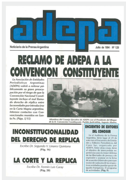
Julio de 1994.

¿Por qué la preocupación especial de la prensa si en los proyectos de reforma se recorrían prácticamente todos los aspectos de la vida nacional? Primero, por cierto entrenamiento que te-